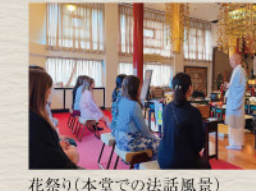
花祭り(本堂での法話風景)