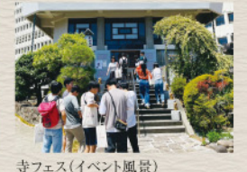
寺フェス(イベント風景)

【宝泉寺 庭園型樹木葬 瑠璃の光 概要】●所在地/東京都新宿区西早稲田1-1-2 ●施設/本堂、斎場、休憩室、客殿、駐車場 他 ●管理/宗教法人 天台宗 宝泉寺