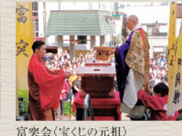
富実会(宝くじの元祖) 毘沙門天王ご開帳