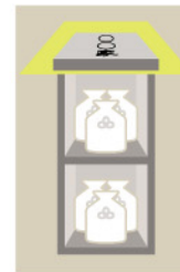
骨袋でのご納骨例

ナビをご利用の方 「新宿区西早稲田1-1-2」で検索のうえお越しください。〈駐車場完備〉