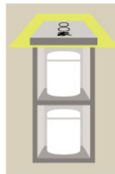
骨壺でのご納骨例